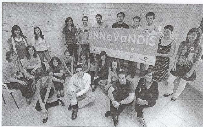
Imagen de algunos de los iNNoVaNDeRS.