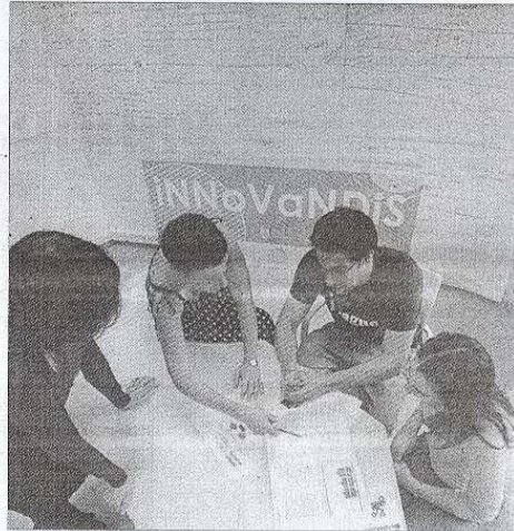
iNNoVaNDeRS debatiendo sobre un proyecto.

Los chavales "aprenden haciendo" y son ellos mismos los que crean un entorno innovador para la transmisión de valores